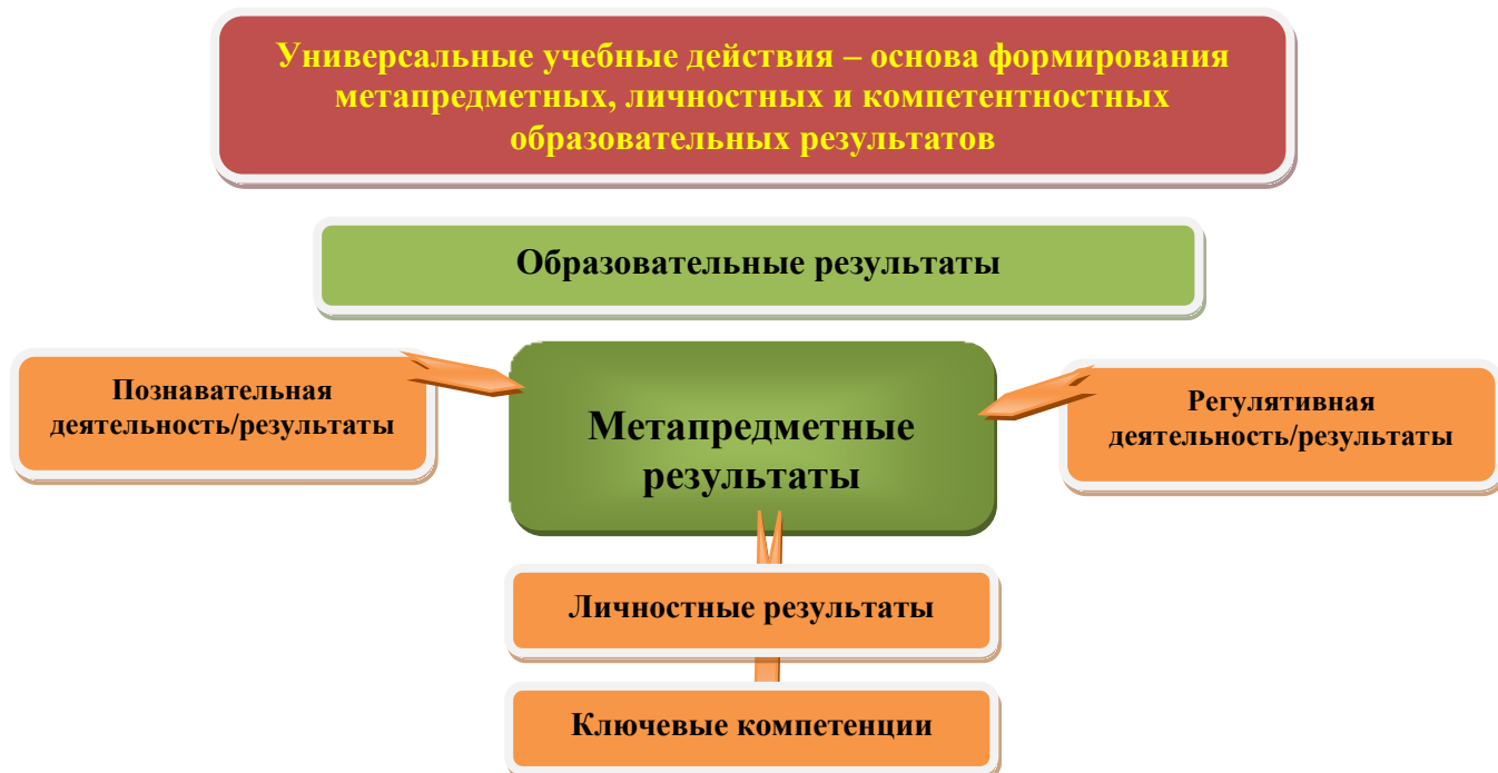
Рис. 3. Система оценки образовательных результатов

частности, итоговая оценка обучающихся определяется с учётом их стартового уровня и динамики образовательных достижений.