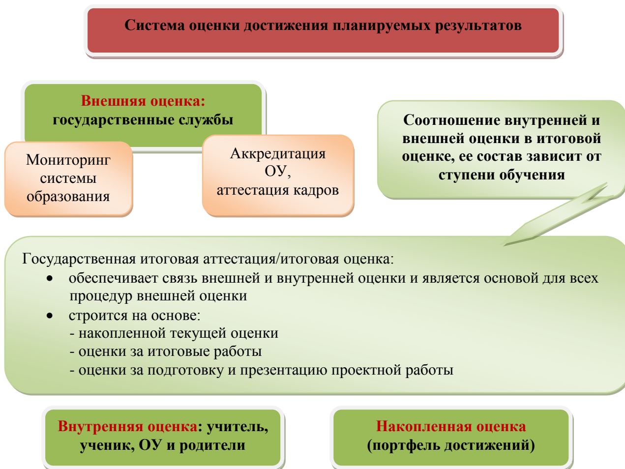
Рис. 2. Система оценки достижения планируемых результатов

Полученные данные используются для оценки состояния и тенденций развития системы образования разного уровня (рис. 2).