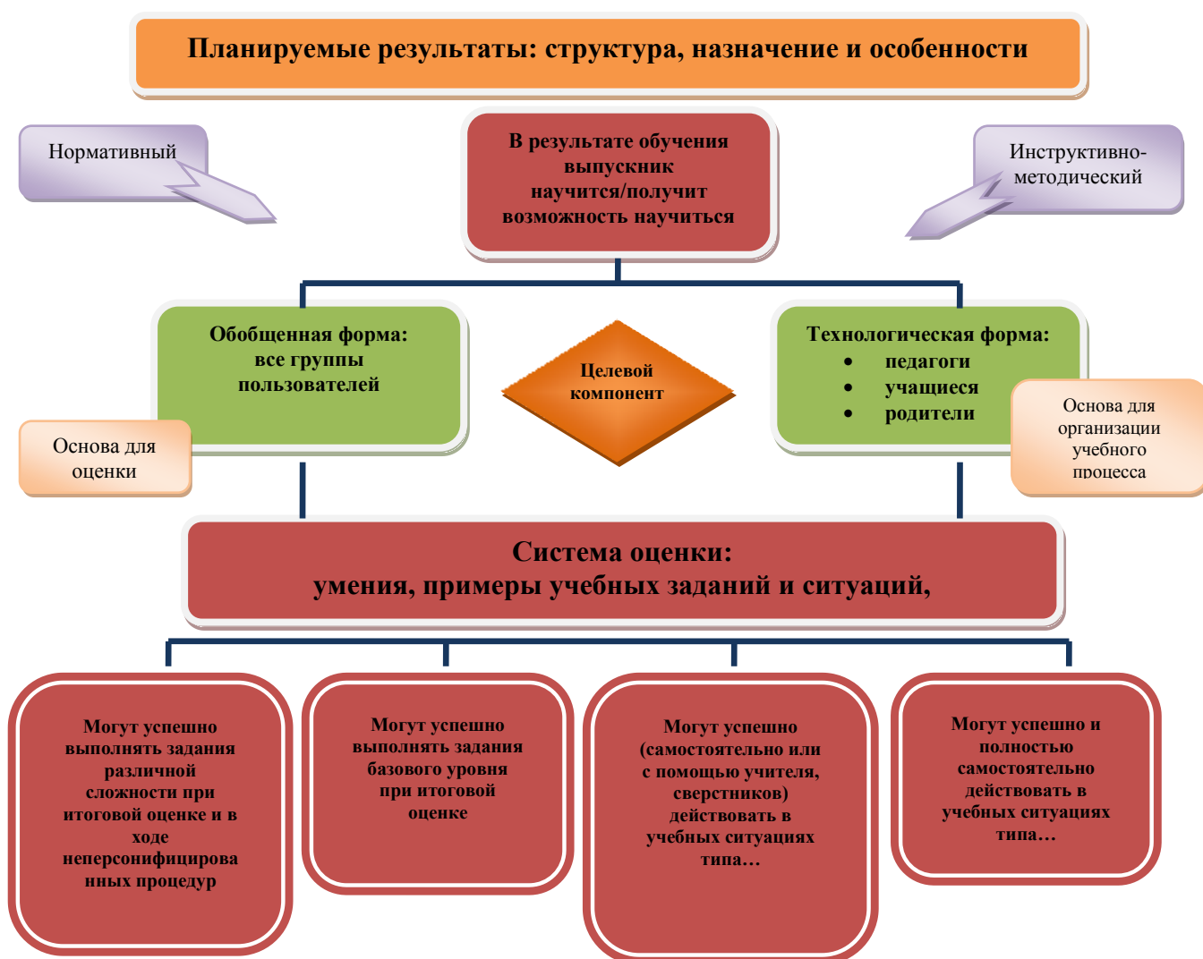
Рис. 1. Особенности структуры планируемых результатов. Функция и назначение.

Система оценки достижения планируемых результатов освоения основной образовательной программы основного общего образования (далее – система оценки) представляет собой один из инструментов реализации требований Стандарта к результатам освоения основной образовательной программы основного общего образования, направленный на обеспечение качества образования, что предполагает вовлечённость в оценочную деятельность как педагогов, так и обучающихся (рис. 1).